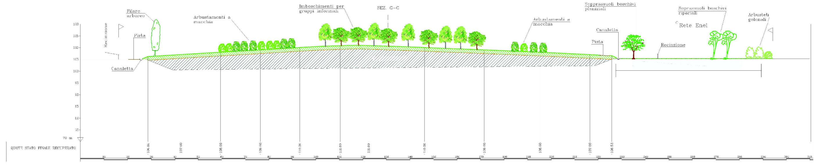
SEZIONE VISTA LATO CASCINA PITocca